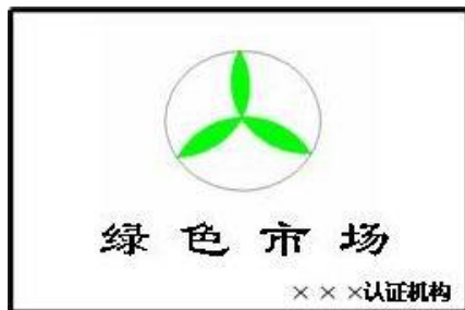
绿色市场认证标牌基本图案